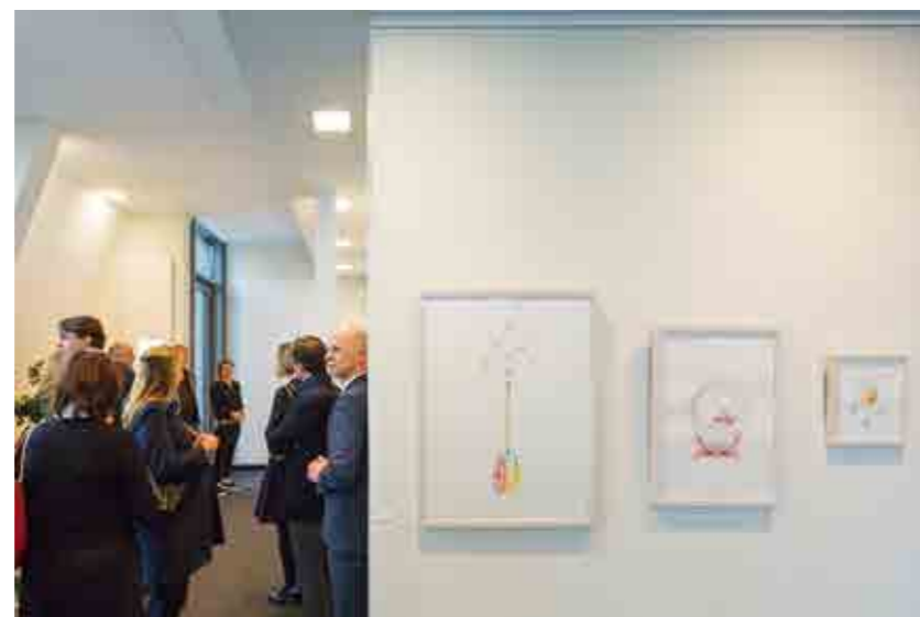
Führung der Familienunternehmer 2015

Ein Highlight ist die Wandgestaltung der Künstlerin Debbie Smith hinter der Rezeption: eine Weltkarte aus Nägeln und gespannten Metallfäden, die die heutigen Schiffsrouten darstellen.